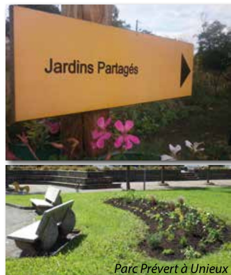
Parc Prévert à Unieux

Si ce projet vous intéresse, veuillez laisser vos coordonnées à la mairie au 04 77 40 30 80.