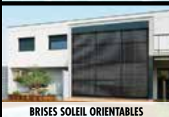
BRISÉS SOLEIL ORIENTABLES

Rue Charles de Gaulle - ZAC du Parc Holtzer 42240 UNIEUX Tél. 04 77 89 00 93 • bds43@boutiquedustore.fr www.boutiquedustore.fr