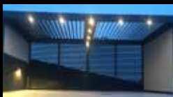
PERGOLAS TOILES OU BIOCLIMATIQUES