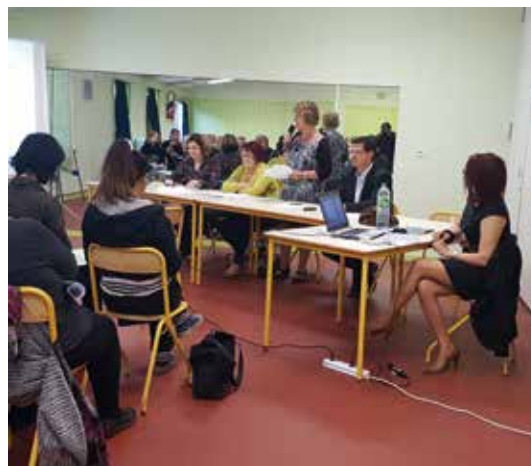
Dernière assemblée générale