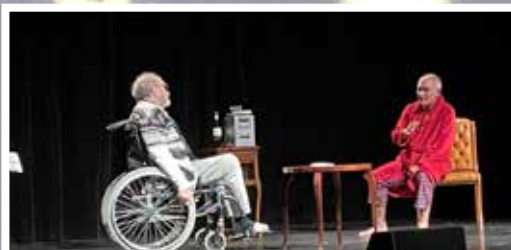
Cie les Amis Z'en Scène Le Voyage

Au plaisir de se retrouver en 2022... Les 7, 8 et 9 octobre !