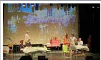
Cie Le grand baz'art Tranches de vie d'une famille ordinaire