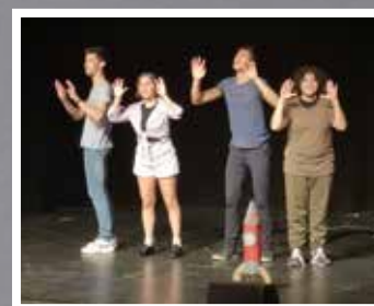
Classe de terminale, Lycée Albert Camus Chroniques Martiennes