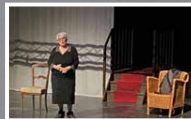
Cie Le petit moussaillon Bernardine