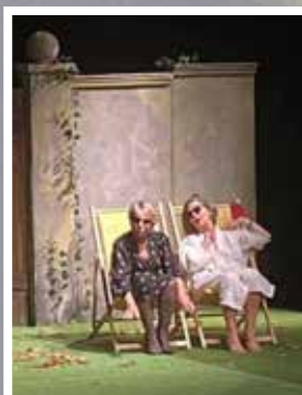
Cie l'œil en coulisses Sœurs