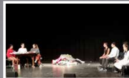
Classe de 1 ère , Lycée Albert Camus Grand manège