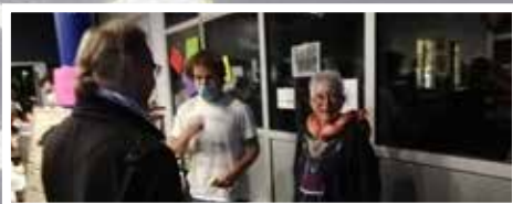
La buvette tenue par l'association caritative La Ligue du sourire