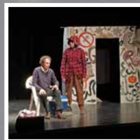
Cie et quoi encore ? Dialogue d'un chien avec son maître sur la nécessité de mordre ses amis