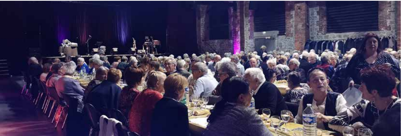
Repas du Maire 2020 à la salle de la Forge au Chambon-Feugerolles