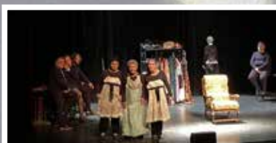
Cie Act'Bas Cendrillon