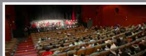
Bord de scène