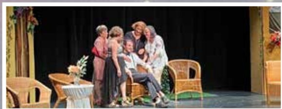
Cie les baladins Tout feu, tout femme