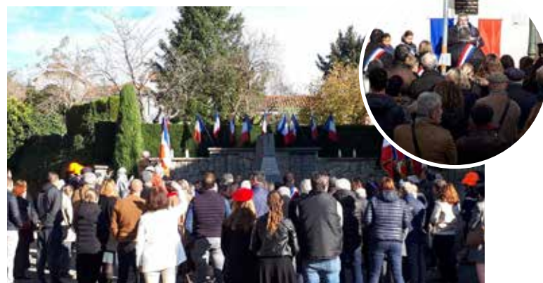
De nombreuses personnes étaient présentes pour l'inauguration et la cérémonie du 11 novembre