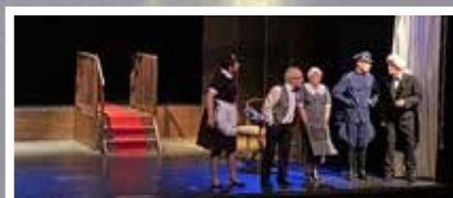
Cie La sabarcane Le voyageur sans bagage