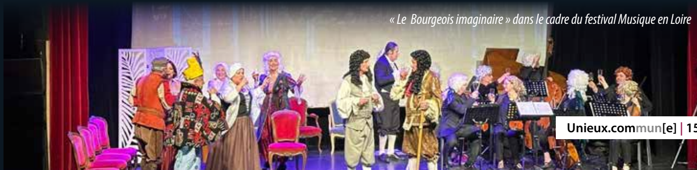
« Le Bourgeois imaginaire » dans le cadre du festival Musique en Loire

Pour fêter cette 10 e édition en février 2024, les troupes du Petit Moussaillon et de la Sarbacane se sont réunies avec l'ensemble Unisoni, spécialisé dans la musique baroque. Sous la direction de Gérald Casetto de la Compagnie « Maintes et une fois », ils ont offert au public une interprétation d'une création originale racontant la rencontre entre Molière et Lully au château de Versailles. Dans une salle comble, cette performance a mêlé des répliques du Bourgeois Gentilhomme et du Malade Imaginaire avec les musiques et menuets de Lully et Charpentier.