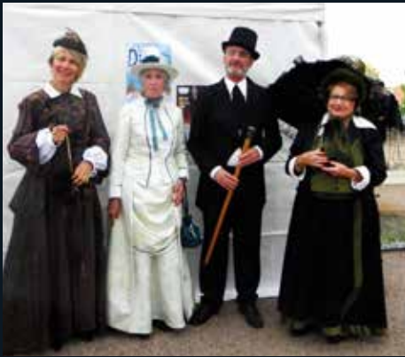
Une partie de la troupe du Petit Moussaillon d'Aurec-sur-Loire lors de la 1 ère édition sur le marché d'Unieux