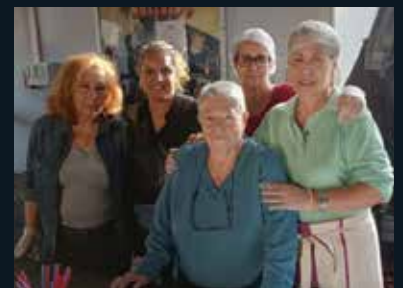
Buvette tenue par le Centre Social

Depuis le début, il faut également noter la collaboration avec des associations, notamment le Centre Social d'Unieux, qui gèrent l'espace buvette/restauration permettant ainsi des temps d'échanges fortement appréciés autour d'un verre après les représentations.