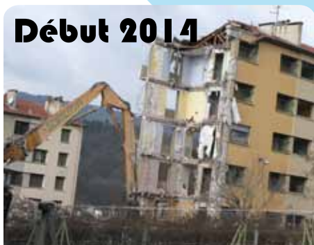
Déconstruction des bâtiments Penel