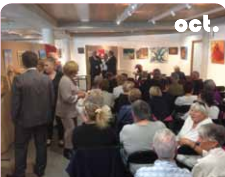
Vente aux enchères au profit de la Recherche Médicale