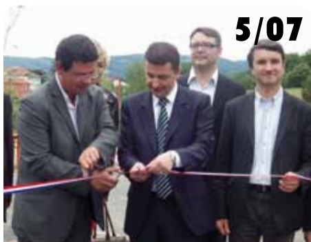
Inauguration du Parc Design