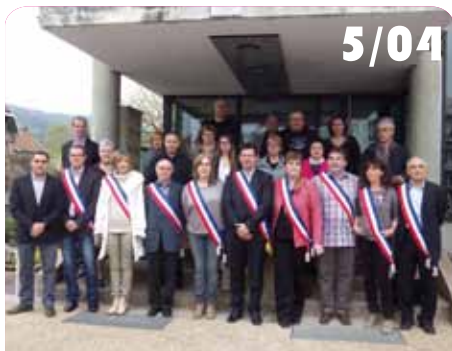
Installation du nouveau Conseil Municipal