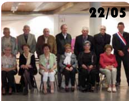
Cérémonie des noces de mariage