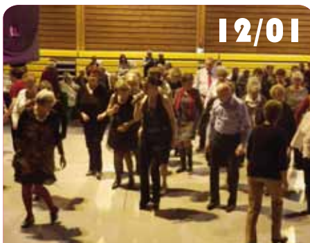
Repas du C.C.A.S pour les seniors