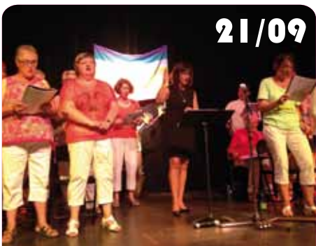
Journée internationale de la Paix