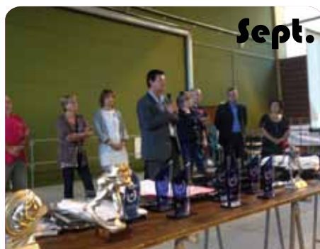
Trophées aux sportifs et bénévoles