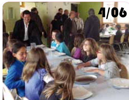
Inauguration du périscolaire du Bourg