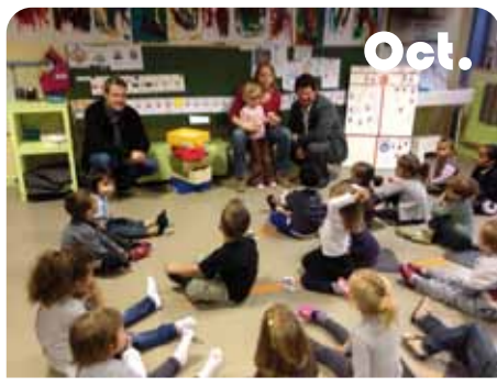
Distribution de la Quartouch' dans les écoles