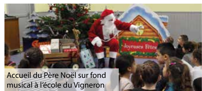
Accueil du Père Noël sur fond musical à l'école du Vigneron