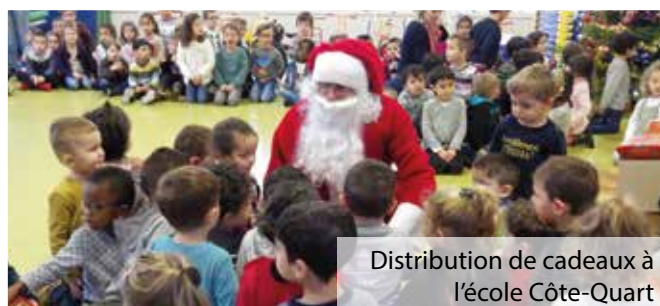
Distribution de cadeaux à l'école Côte-Quart