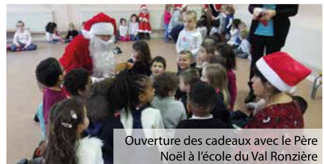
Ouverture des cadeaux avec le Père Noël à l'école du Val Ronzière