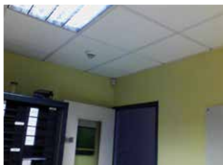
Photographies prises avec une caméra thermique

S aint-Étienne Métropole, en collaboration avec la commune d'Unieux, a entrepris de réaliser une thermographie aérienne du territoire, permettant d'évaluer les déperditions thermiques de tout type de bâtiment.