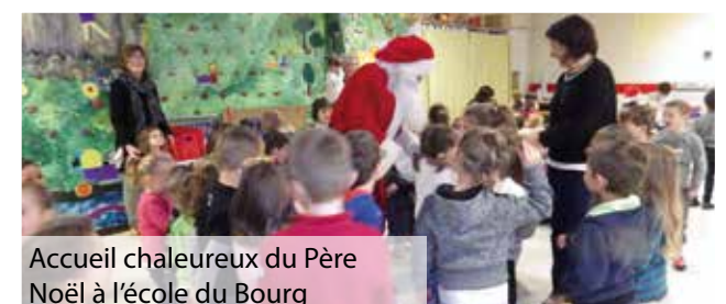
Accueil chaleureux du Père Noël à l'école du Bourg