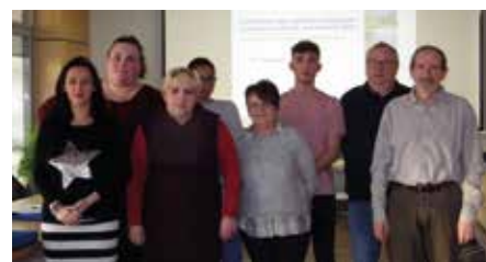
Les agents recenseurs de votre commune

Le recensement permet de connaître le nombre de personnes qui vivent en France. Il détermine la population officielle de chaque commune. De ces chiffres découle notamment la participation de l'État au budget des communes : plus une commune est peuplée, plus cette participation est importante.