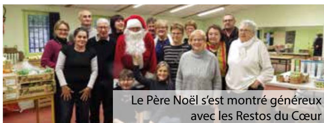
Le Père Noël s'est montré généreux avec les Restos du Cœur

Il a également rendu visite à l'association les Restos du Cœur pour lui remettre des clémentines.